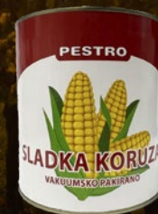
482160 KORUZA V PLOČEVINKI PESTRO 2650 ml, pakiranje 6 × 2650 ml