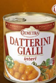
482495 PARADIŽNIK ČEŠNJEV RUMENI CELI V LASTNEM SOKU 800 g, pakiranje 6 × 800 g