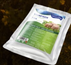
482383 TUNA V RASTLINSKEM OLJU VREČKA 1000 g, pakiranje 12 × 1000 g