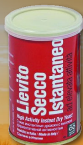
484078 KVAS PIVSKI SUHI ITALMILL 100 g, pakiranje 10 × 100 g