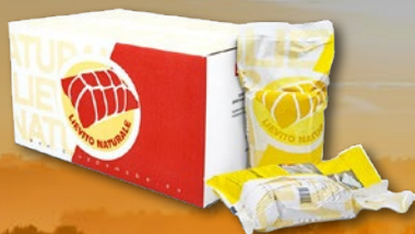
484077 DROŽI ENERPIZZA ITALMILL 1 kg, pakiranje 10 × 1 kg