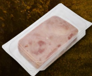
480232 ŠUNKA KUHANA NAREZEK PIK 500 g, pakiranje 12 × 500 g