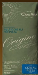
484766 MOKA T-1 MEŠANICA CEREAL CASILLO 15 kg, posamično