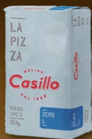
484764 MOKA T-0 ZERO L-W340 CASILLO 12,5 kg, posamično

Moke Casillo iz juga Italije so v različnih kombinacijah primerne za vse vrste pizz: Romana, Napolitana, Pala, Pinsa, za kruh in focače.