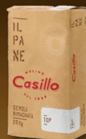
484763 MOKA DURUM TOP-W220 CASILLO 25 kg, posamično