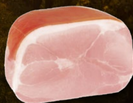
481073 PRŠUT KUHAN PREMIUM cca. 4 - 5 kg/kos, posamično