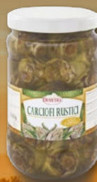
482593 ARTIČOKE V SONČNIČNEM OLJU 1700 ml, pakiranje 6 × 1700 ml