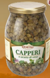
482467 KAPRE V VINSKEM KISLU 1000 ml, pakiranje 6 × 1000 ml