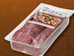
480228 SALAMA SUHA NAREZEK PIK 500 g, pakiranje 12 × 500 g