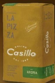
484765 MOKA T-1 AROMA W280 CASILLO 12,5 kg, posamično