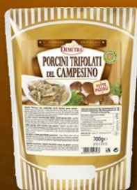
482474 JURČKI DUŠENI CAMPESINO 700 g, pakiranje 6 × 700 g