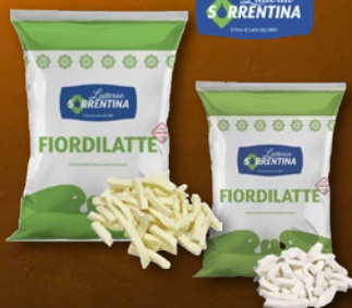
476552 IN 476563 SIR FIORDILATTE REZ: JULIENNE IN NAPOLI 2 kg, pakiranje 8 × 2 kg