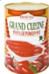
POLPA S KOŠČKI PARADIŽNIKA 4050G

šifra teža em v kartonu prod. enota 482268 2,5 KOM 6 1