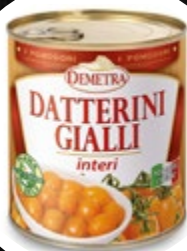
PARADIŽNIK ČEŠ. RUMENI CELI V L.SOKU 800G

šifra teža em v kartonu prod. enota 482614 1,5 KOM 6 1