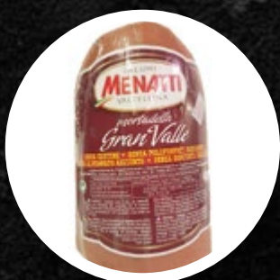
MORTADELA GRAN VALLE MENATTI CCA.3KG