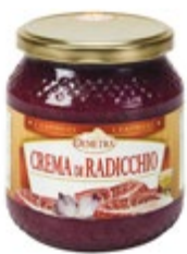
KREMA IZ RDEČEGA RADIČA 580ML-530G

šifra teža em v kartonu prod. enota 482466 0,56 KOM 6 1