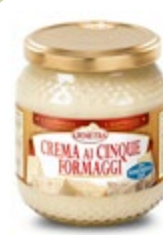
KREMA IZ PETIH VRST SIRA 580ML-560G

šifra teža em v kartonu prod. enota 482465 0,54 KOM 6 1