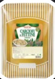
ARTIČOKE NAREZANE ZAČINJENE 1700G