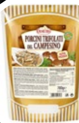
JURČKI DUŠENI CAMPESINO 700G

šifra teža em v kartonu prod. enota 482470 0,7 KOM 6 1