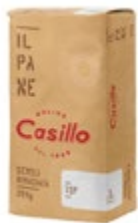
MOKA DURUM TOP-W220 CASILLO 25KG