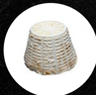
SIR RICOTTA DIMLJENA CCA 250G