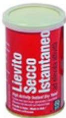
KVAS PIVSKI SUHI ITALMILL 100G-10KOM