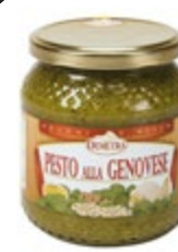
KREMA PESTO GENO- VESE 580ML-540G

šifra teža em v kartonu prod. enota 482595 0,53 KOM 6 1