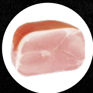
PRŠUT KUHAN PREMIUM CCA. 4KG