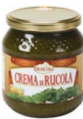
KREMA IZ RUKOLE 580ML-550G

šifra teža em v kartonu prod. enota 482479 0,53 KOM 6 1