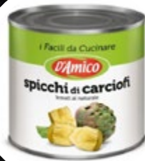
ARTIČOKE REZANE 2550G