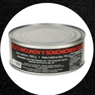
FILETI INČUNOV SLANI V RASTL. OLJU 1000G