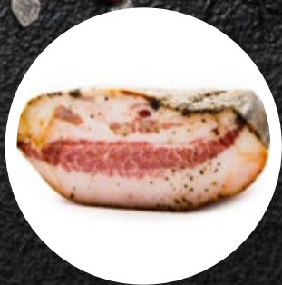
GUANCIALE S POPROM-SV. LIČNICE CCA 1,3KG