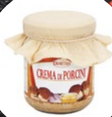
KREMA Z JURČKI 580ML-540G

šifra teža em v kartonu prod. enota 482464 0,55 KOM 6 1