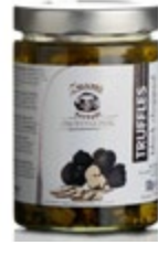
TARTUFI ČRNI REZANI V OLJENEM OLJU 500G

šifra teža em v kartonu prod. enota 486531 1 KG 1 0,5