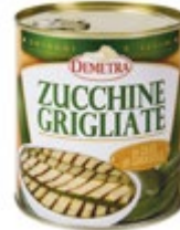
BUČKE PEČENE V SONČNIČNEM OLJU 800G

šifra teža em v kartonu prod. enota 482591 0,793 KOM 6 1