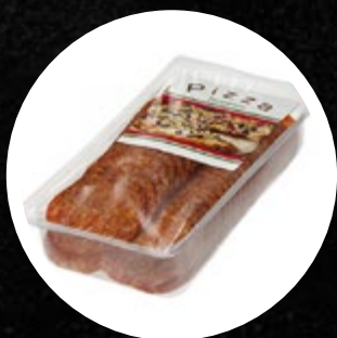
SALAMA PEPPERONI NAREZEK PIK 500G