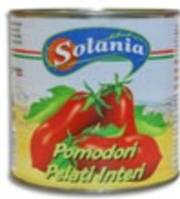
PELATI SOLANIA 2500G

šifra teža em v kartonu prod. enota 482600 2,55 KOM 6 1