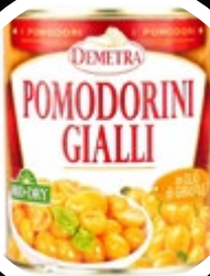
PARADIŽNIK ČEŠ. RUMENI DELNO SUŠEN 750G

šifra teža em v kartonu prod. enota 482507 0,8 KOM 6 1