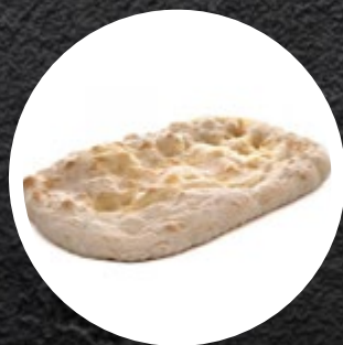
PODLOGA ZA GURMAN. PIZZO PRED. 560G-5KOM