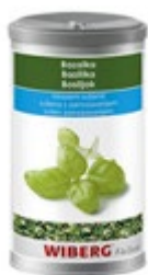
BAZILIKA ZAMRZ. SUŠENA 1200ML-55G