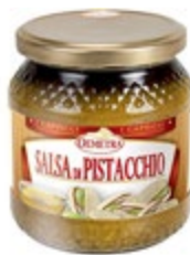
KREMA IZ PISTACIJ 580ML-530G

šifra teža em v kartonu prod. enota 482483 0,55 KOM 6 1