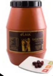
OLIVE KALAMATA IZKOŠČIČENE 2KG