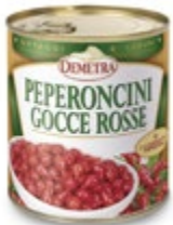
PAPRIKE MINI RDEČE SLADKO KISLE 793G

šifra teža em v kartonu prod. enota 482616 0,5 KOM 6 1