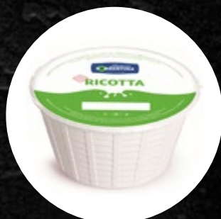
SIR RICOTTA L. SORRENTINA 1,5KG