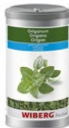
ORIGANO ZAMRZ. SUŠEN 1200ML-65G