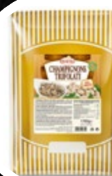
ŠAMPINJONI DUŠENI REZINE 1700G

šifra teža em v kartonu prod. enota 482569 0,7 KOM 6 1