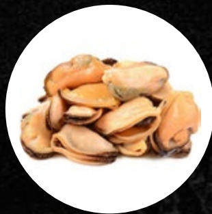
DAGNJE MESO 200- 300 KOS/KG