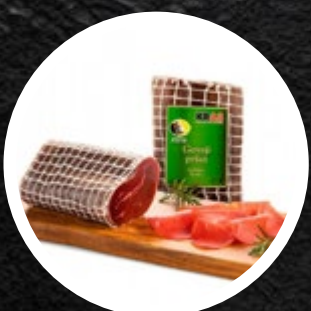
PRŠUT GOVEJI BRESAOLA