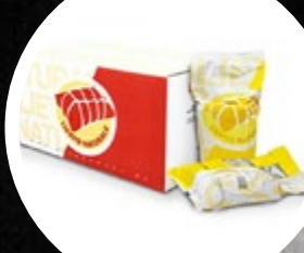
DROŽI ENERPIZZA ITALMILL 1KG