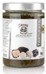
TARTUFATA ČRNA 500G

šifra teža em v kartonu prod. enota 482427 0,5 KOM 6 1