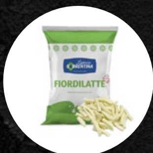
SIR FIORDILATTE REZ JULIENNE 2KG