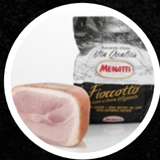
PRŠUT KUHAN FIOCCOTTO MENATTI CCA 7KG