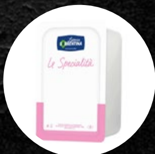
SIR STRACCIATELLA L. SORRENTINA 250G