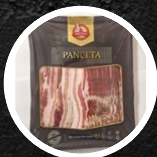
PANCETA DALMATINSKA NAREZEK 300G