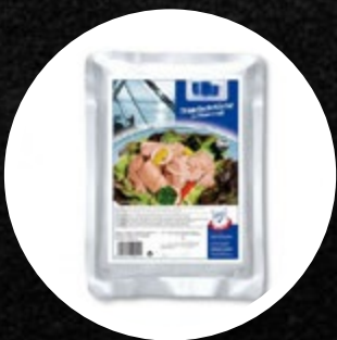
TUNA V RASTLINSKEM OLJU VREČKA 1000G