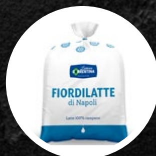
SIR FIORDILATTE NAPOLI 1 KG