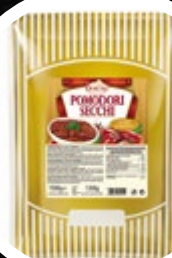
PARADIŽNIK SUŠEN V S.OLJU VREČKA 1500G

šifra teža em v kartonu prod. enota 482541 4,1 KOM 3 1