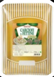
ARTIČOKE NAREZANE DEMETRA 1500G