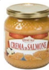
KREMA IZ LOSOSA 580ML-550G

šifra teža em v kartonu prod. enota 482481 0,52 KOM 6 1