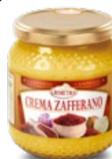
KREMA IZ ŽAFRANA 580ML-540G

šifra teža em v kartonu prod. enota 482601 0,54 KOM 6 1