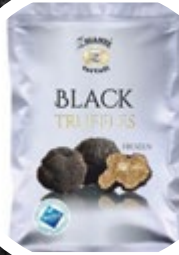
TARTUFI ČRNI 500G ZM

šifra teža em v kartonu prod. enota 482424 0,5 KOM 6 1