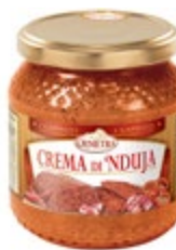
KREMA NDUJA 580ML-530G

šifra teža em v kartonu prod. enota 482484 0,53 KOM 6 1