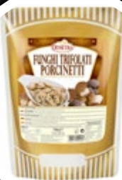
JURČKI IN KOSTANJEVKE DUŠENI REZINE 700G

šifra teža em v kartonu prod. enota 482470 0,7 KOM 6 1