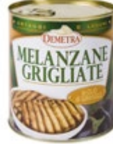
JAJČEVCI PEČENI V SONČNIČNEM OLJU 800G

šifra teža em v kartonu prod. enota 482486 0,8 KOM 6 1