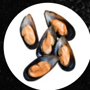
DAGNJE V POLLUPINI 80-100KOS/KG