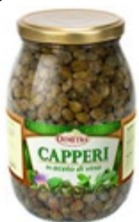
KAPRE V VINSKEM KISU 1000ML