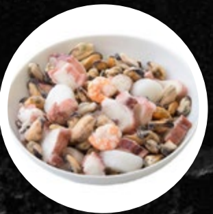
MORSKI SADEŽI BREZ SURIMI PESTRO 1KG