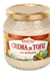
KREMA IZ TOFUJA Z ZELIŠČI 580ML-520G

šifra teža em v kartonu prod. enota 482480 0,55 KOM 6 1