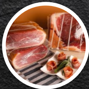
SUŠENO SV. STEGNO ITALIJA B.K. CCA 2,5KG