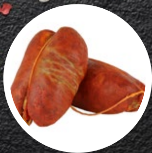
SALAMA NDUJA SPILIN- GA ZOP CCA. 400G