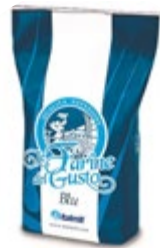
MOKA BLU ITALMILL 10KG