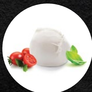
SIR MOZZARELLA DI BUFFALA LS 125G