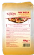
MOKA MIX BREZ GLUTENA CASILLO 10KG