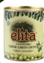
OLIVE ZELENE BREZ KOŠČIC PESTRO 4100G