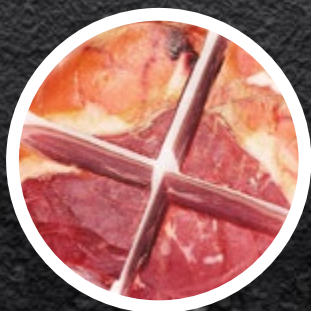
PRŠUT B.K. KOSI 1/4