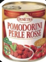
PARADIŽNIK ČEŠ. RDEČI DELNO SUŠEN 800G

šifra teža em v kartonu prod. enota 482495 0,8 KOM 6 1