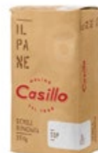
MOKA T-1 MEŠANICA CEREAL CASILLO 15 KG