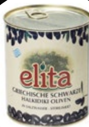
OLIVE ČRNE BREZ KOŠČIC PESTRO 4100G