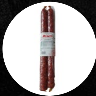
SALAMA PIKANT MENATTI CCA.1KG