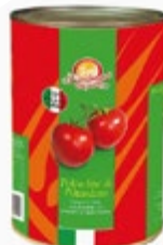
PELATI ITALMILL 2500G

šifra teža em v kartonu prod. enota 482619 2,5 KOM 6 1