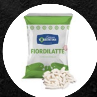
SIR FIORDILATTE REZ NAPOLI 2 KG