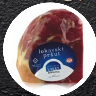
PRŠUT LOKAVSKI POLOVICA