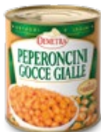
PAPRIKE MINI RUMENE SLADKO KISLE 793G

šifra teža em v kartonu prod. enota 482498 0,793 KOM 6 1