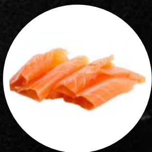
LOSOS DIMLJEN 200G