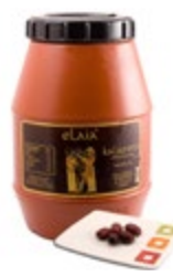
OLIVE KALAMATA - EXTRA JUMBO 2KG