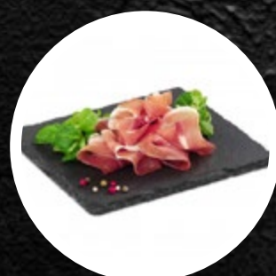
PRŠUT NAREZEK PESTRO 500G