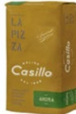
MOKA T-1 AROMA W280 CASILLO 12,5 KG