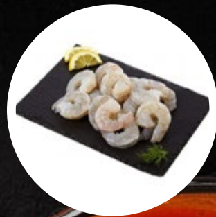
KOZICE OČIŠČENE IN BLANŠIRANE UZO