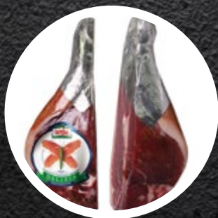
PRŠUT B.K. POLOVICA