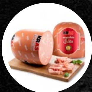
MORTADELA V KOSU