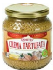
KREMA S TARTUFI 580ML-540G

šifra teža em v kartonu prod. enota 482463 0,54 KOM 6 1