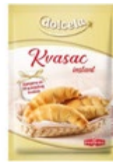
KVAS SUHI 7G-50KOM