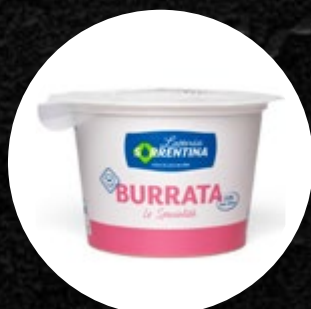
SIR BURRATA L. SORRENTINA 100G