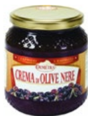
KREMA S ČRNIMI OLIVAMI 580ML-550G

šifra teža em v kartonu prod. enota 482463 0,54 KOM 6 1