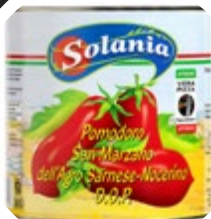
PARADIŽNIK SAN MARZANO ZOP SOLANIA 2550G

šifra teža em v kartonu prod. enota 482600 2,55 KOM 6 1