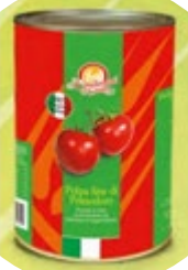
POLPA PARADIŽNIKOVA ITALMILL 4,1KG

šifra teža em v kartonu prod. enota 482506 4,05 KOM 3 1