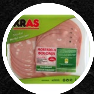
MORTADELA BOLONJA NAREZEK 500G