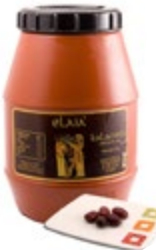
OLIVE KALAMATA COLOSSAL 2KG