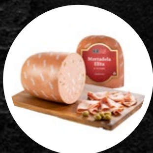
MORTADELA V KOSU Z OLIVAMI