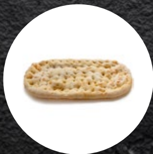
PODLOGA ZA GURMAN. PIZZO PRED. 230G-15