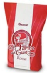
MOKA ROSSA ITALMILL 10KG