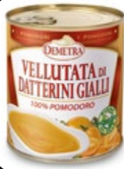
PIRE RUMENEGA ČEŠ. PARADIŽNIKA 800G

šifra teža em v kartonu prod. enota 482086 4,1 KOM 3 1