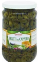
KAPRE JAGODE V VINSKEM KISU 1700ML