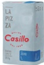
MOKA T-0 ZERO L-W340 CASILLO 12,5 KG