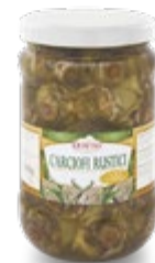
ARTIČOKE V SONČNIČ- NEM OLJU 1700ML