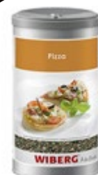
MEŠANICA ZAČIMB PIZZA 1200ML-190G