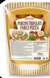
JURČKI DUŠENI REZINE IN KOSI 700G

šifra teža em v kartonu prod. enota 482474 0,7 KOM 6 1