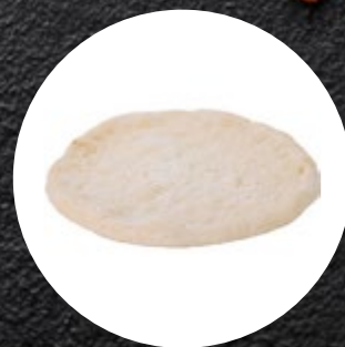
PODLOGA ZA PIZZO F132 300G-14KOM