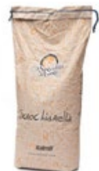
MEŠANICA SCROCCHIARELLA ITALMILL 10KG