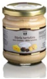
TARTUFATA BELA 500G

šifra teža em v kartonu prod. enota 482427 0,5 KOM 6 1