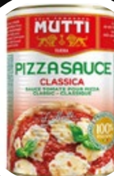
OMAKA Z ZAČIMBAMI MUTTI 4100G

šifra teža em v kartonu prod. enota 482604 0,8 KOM 6 1