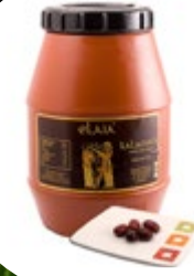
OLIVE KALAMATA REZINE 2KG